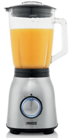
Blender Stainless Steel 1000 01.212091.01.001

PARTS DESCRIPTION / ONDERDELENBESCHRIJVING / DESCRIPTION DES PIÈCES / TEILEBESCHREIBUNG / DESCRIPCIÓN DE LAS PIEZAS / DESCRIÇÃO DOS COMPONENTES / DESCRIZIONE DELLE PARTI / BESKRIVNING AV DELAR / OPIS CZĘŚCI / POPIS SOUČÁSTI / POPIS SUČASTI / ОПИСАНИЕ ЗАПЧАСТИ